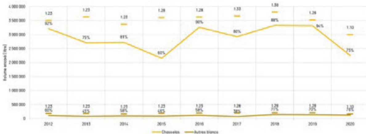
Fig. 2: Quotas maximum et production effective du Chasselas et des autres cépages blancs au Chablais – (Données Etat de Vaud, 2012 – 2020).