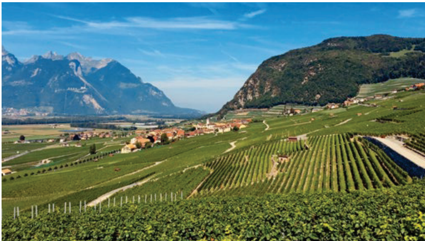
Chablais vaudois, photo : Swiss Wine Promotion SA.

Cet article est publié en 2 production, la première dans le présent numéro, et la deuxième dans Vignes et Vergers n° 10 (octobre 2022).