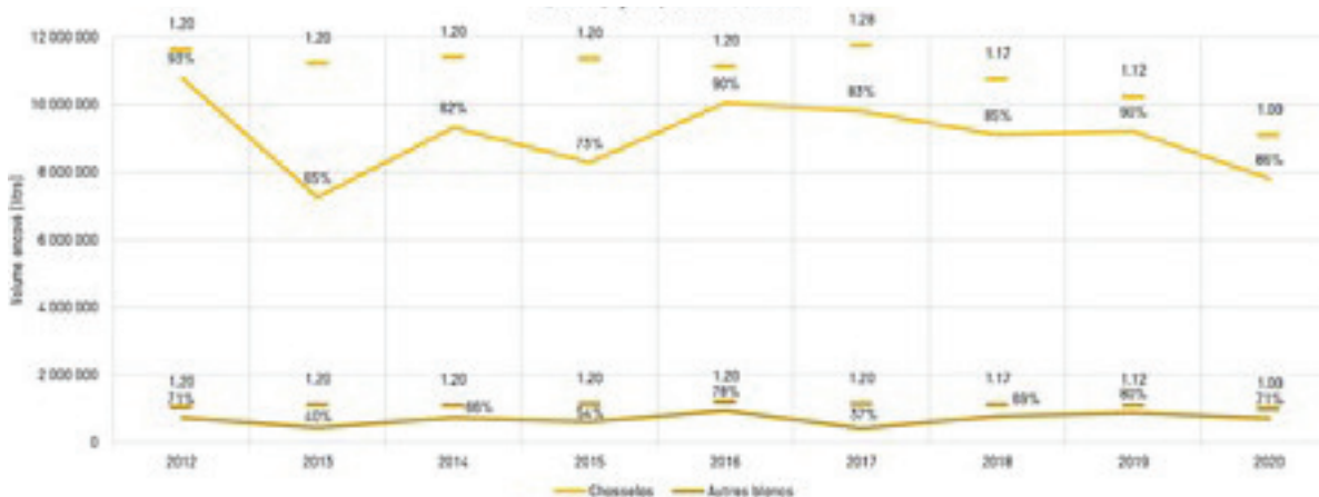
Fig. 4 : Quotas maximum possibles et production effective du Chasselas et des autres cépages blancs à La Côte – (Données Etat de Vaud, 2012– 2020) .

Pour Lavaux, les taux d'atteinte des quotas sont compris entre 65 % (2015) et 95 % (2012), correspondant à des variations de production, de 3.6 à 5.2 millions de litres (figure 3).