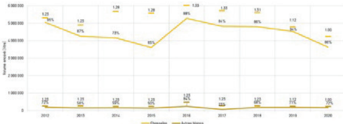
Fig. 3 : Quotas maximum et production effective du Chasselas et des autres cépages blancs en Lavaux – (Données Etat de Vaud, 2012– 2020).