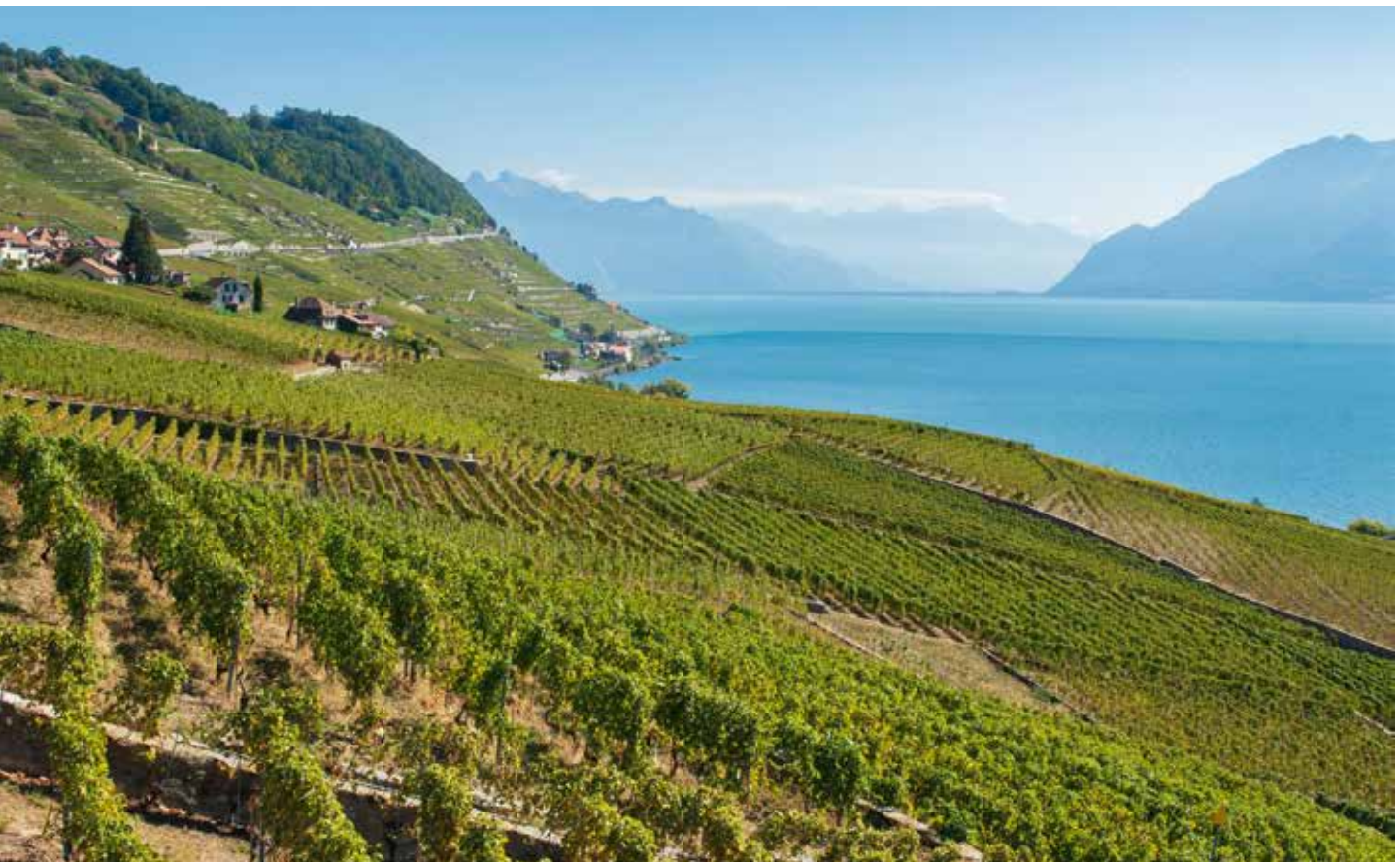
Vignoble de Lavaux avec vue sur le Dézaley.

Renseignements : Vivian Zufferey, tél. +41 58 468 65 61, e-mail : vivian.zufferey@agroscope.admin.ch, www.agroscope.ch