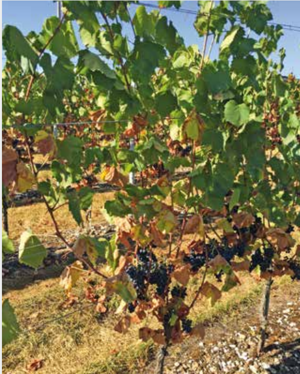
Vignes souffrant d'un stress hydrique sévère.