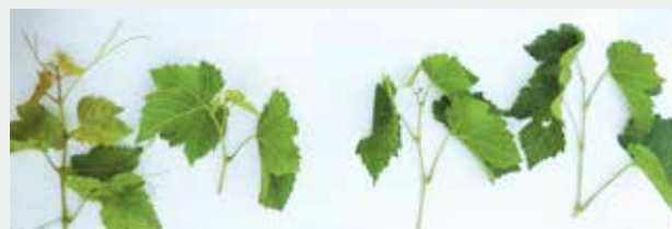
Figure 1 | État de croissance des apex des rameaux de vigne (cv. Chasselas) comme indicateur du stress hydrique. De gauche à droite: Apex en croissance; Ralentissement de la croissance; Arrêt de la croissance avec brunissement de l'apex; Chute de l'apex.

La mesure du \psi_{\text{base}} de la vigne apporte une estimation des ressources en eau du sol et surtout de sa disponibi-