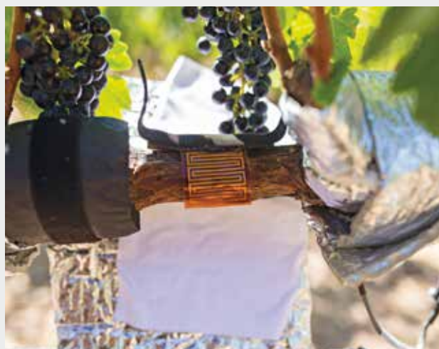
Figure 3 | Capteur de flux de sève.

Cependant, dans le contexte spécifique de la viticulture, l'utilisation de capteurs d'humidité du sol présente plusieurs inconvénients. Dans le vignoble, en effet, les sols sont souvent pierreux et hétérogènes. L'utilisation de capteurs est très délicate, voire impossible dans ce cas. La cartographie des sols permet de mettre en évidence l'hétérogénéité des parcelles et devrait servir à mieux définir l'emplacement des capteurs. Cependant, le morcellement et l'hétérogénéité des parcelles sur de petites distances néces-