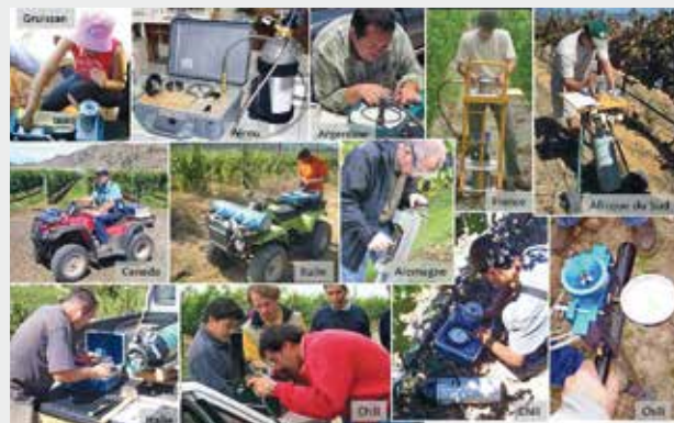
Figure 2 | Utilisation de la bombe Scholander dans différents vignobles.