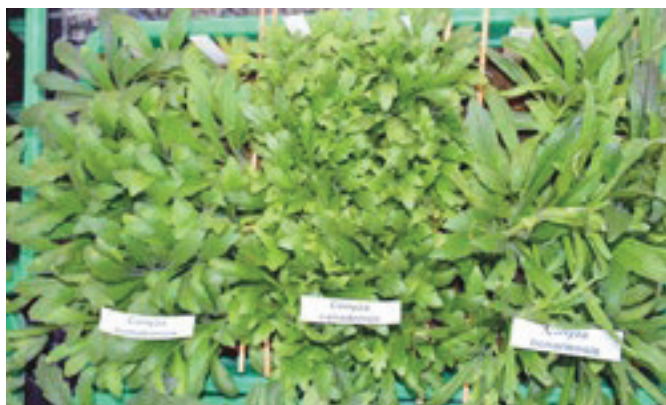
Photo 2: Les trois espèces Conyza sumatrensis , Conyza canadensis et Conyza bonariensis au stade rosette en serre.