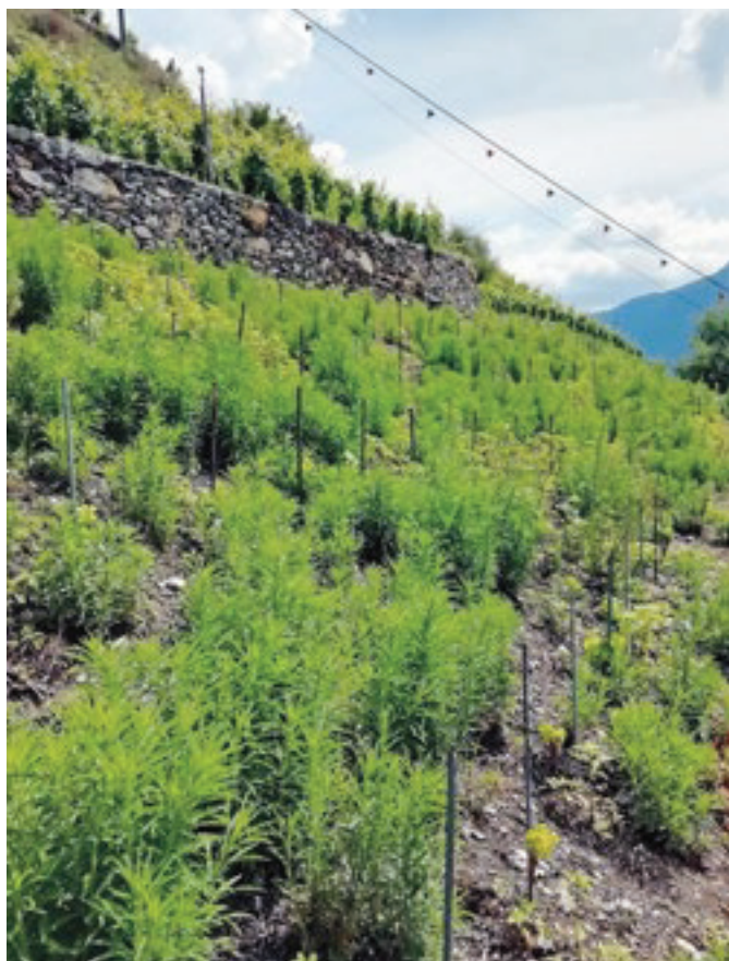
Photo 1: Vignoble valaisan envahi de Conyza résistants au glyphosate.