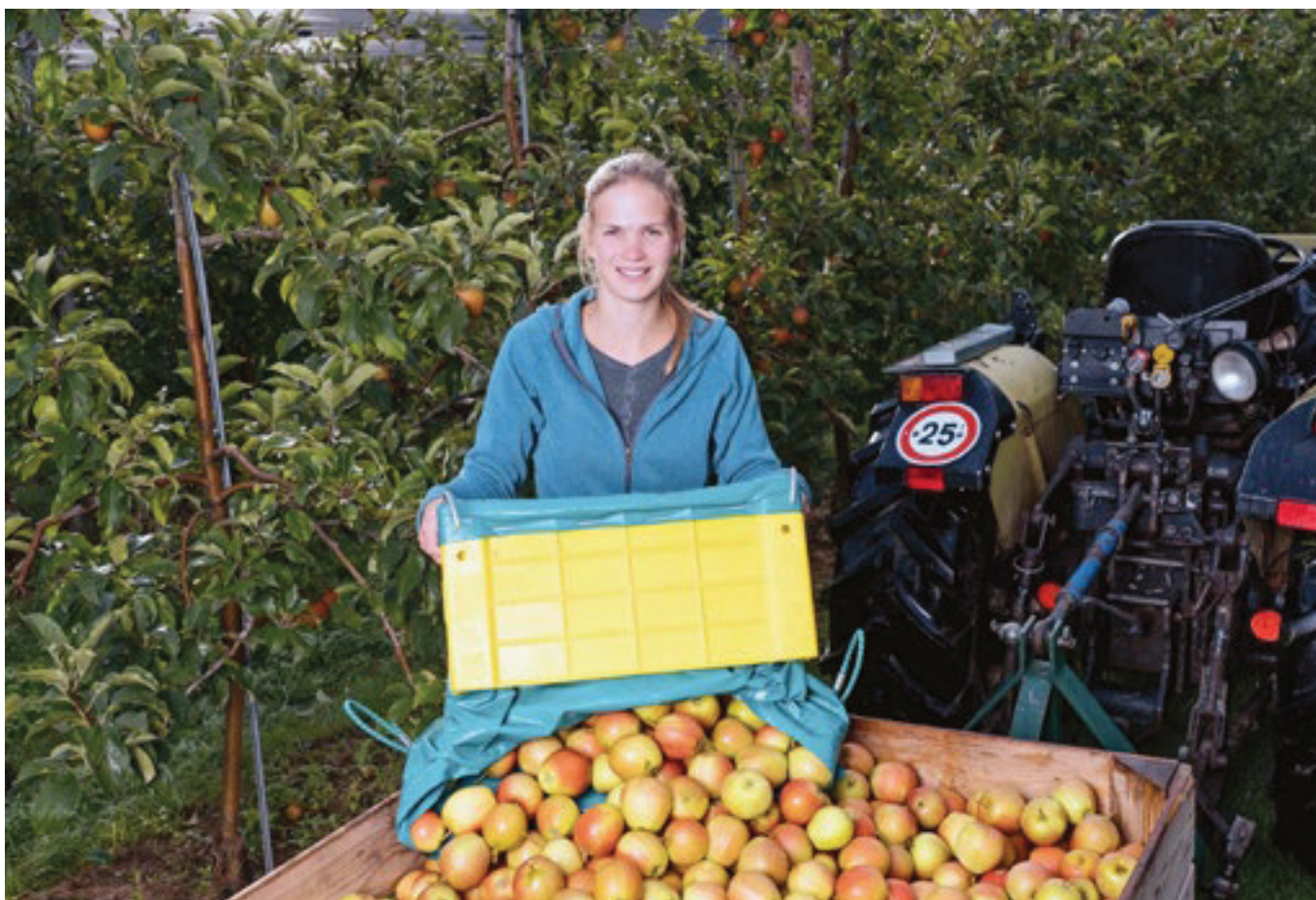
Apprentie CFC Arboricultrice.