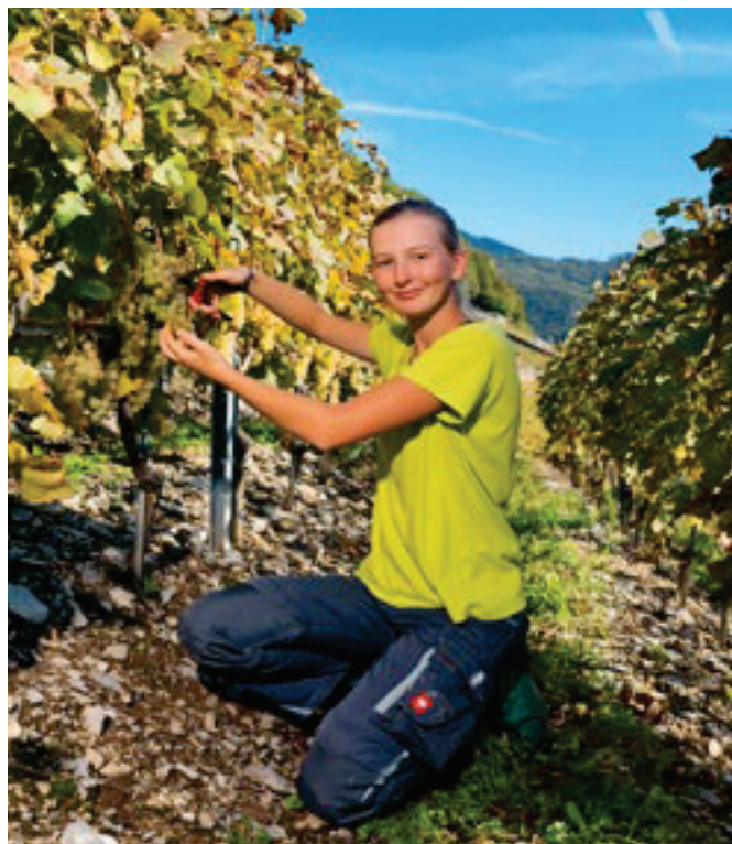
Apprentie CFC Viticultrice.

Voici les chiffres pour les viticulteurs, cavistes et arboriculteurs de 3 ème année (volée 2021–2022).