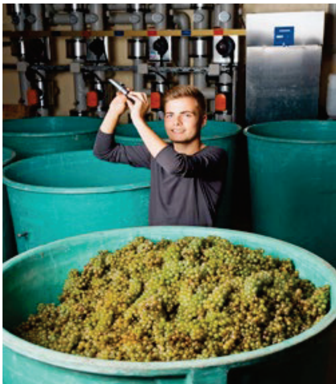
Apprenti CFC Caviste.