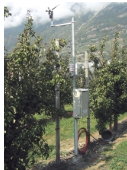
Fig. 1. Exemple de stations de mesures en arboriculture de La Tour-de-Peilz et de Saxon. Les paramètres requis pour la prévision sont mesurés par des stations Campbell CRX ou Lufft HP-100 placées dans les vergers.

à la tavelure sont par ailleurs sensibles à l'oïdium, aux maladies de conservation et aux principaux ravageurs, contre lesquels l'usage de fongicides et d'insecticides est également incontournable.