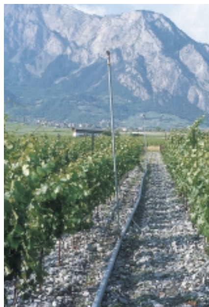
Fig. 3. Variante avec écartement des rangs à 180 cm et une hauteur de feuillage de 120 cm. Leytron (VS).

La notion de surface externe du couvert végétal (SECV) (Murisier, 1996) correspond au pourtour de l'enveloppe foliaire. Elle est représentée par la formule suivante: SECV = [(2 \times H) + e] / E où H = la hauteur de la haie foliaire, e = l'épaisseur de la végétation