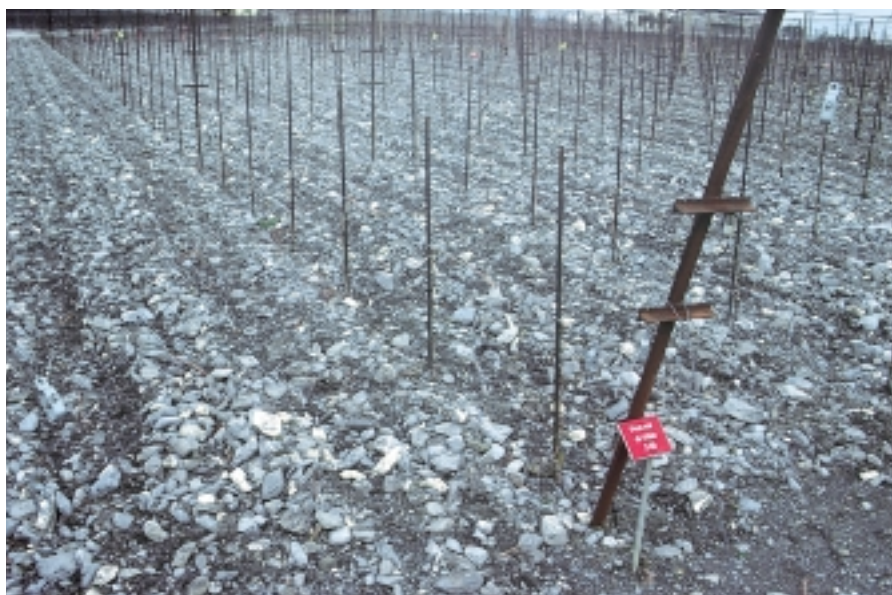
Fig. 2. Sol léger et graveleux de Leytron (VS).

La parcelle est caractérisée par un taux de matière organique de 1,2% et une teneur en calcaire total de 25%.