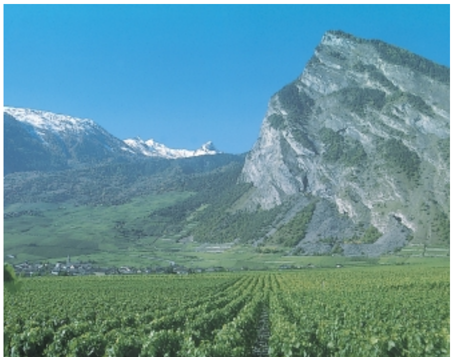
Fig. 1. Vue générale du domaine de Leytron (VS).

En période de forte sécheresse des sols, les systèmes de conduite à surface foliaire exposée élevée (faible distance interligne et hauteur du feuillage importante) ont subi une contrainte hydrique plus marquée que les systèmes à faible surface foliaire exposée. Les échanges gazeux (photosynthèse et transpiration foliaires) ont également diminué avec des volumes importants de végétation.