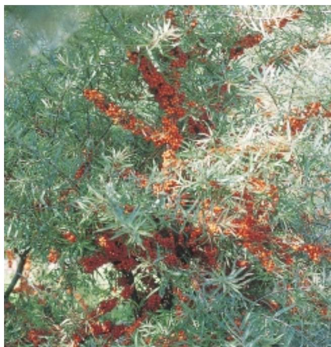
Fig. 1. Buisson d'argousier chargé de fruits au moment de la récolte. ▷

La pulpe des fruits d'argousier est très riche en différents antioxydants. Médiplant a évalué différentes lignées d'argousier pour sélectionner les meilleures origines en vue d'une utilisation cosmétique. L'étude a mis en évidence de grandes différences dans la composition de la pulpe des fruits entre les origines alpines et orientales. Les origines alpines, plus riches en antioxydants et plus pauvres en matière grasse, sont les plus adaptées à l'industrie cosmétique. Le suivi de la maturité des baies a montré une teneur en vitamine C maximale au tout début de la coloration des fruits. Par contre, la teneur en flavonoïdes et en acides de fruits est restée stable durant toute la période de maturation.