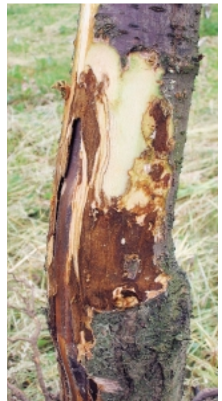
Fig. 1. Attaque de Phytophthora sur porte-greffe cerisier Maxma.