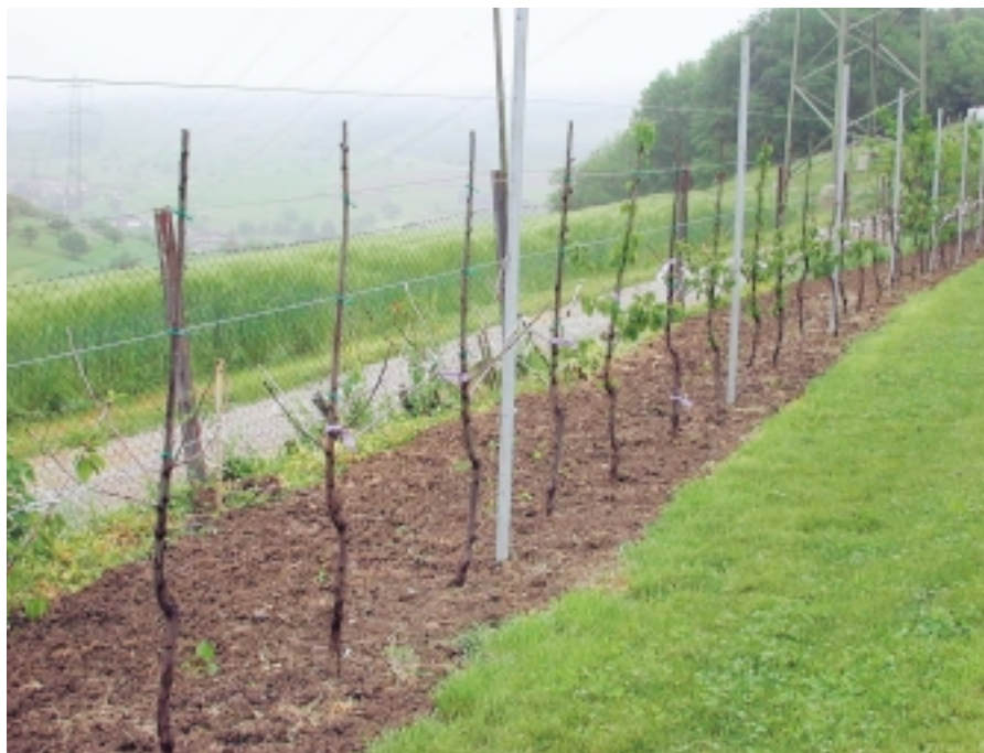
Fig. 3. Cerisiers Kordia greffés sur Hüttner Hochzucht.