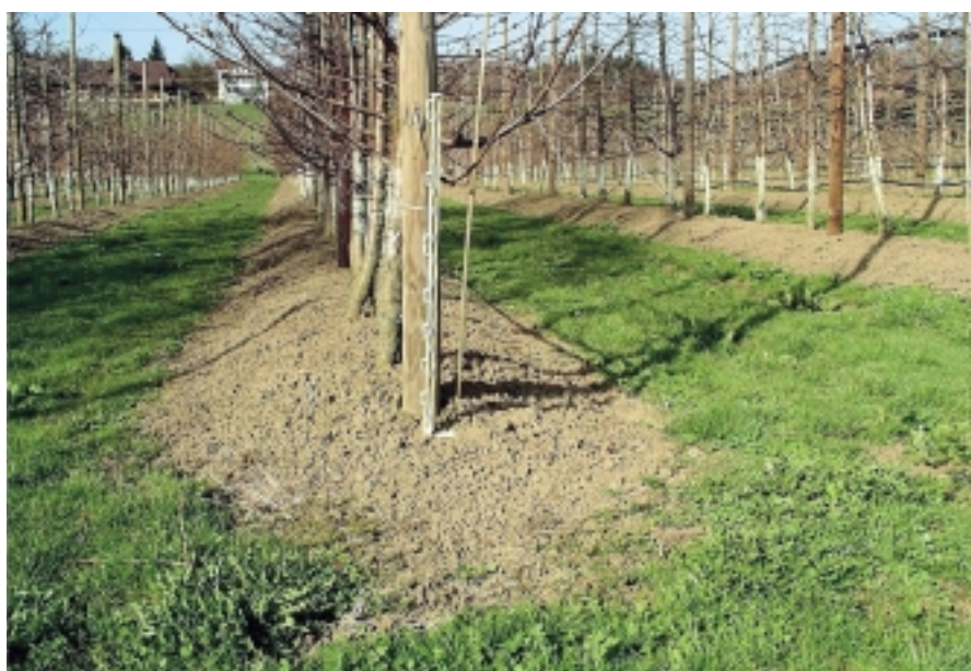
Fig. 2. Culture sur buttes.

L'aire de répartition des attaques montre que T. basicola est répandu dans la