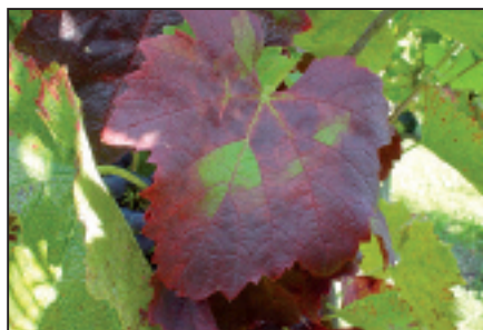
▲ Bois noir: rougissement sectoriel et enroulement d'une feuille de Gamaret. Schwarzholzkrankheit: Sektorielle Rotverfärbung und Blattrollen auf Gamaret.