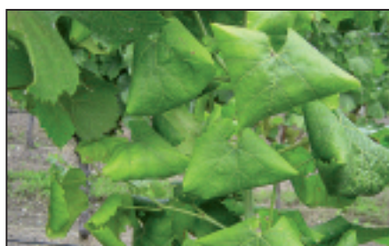
▲ Flavescence dorée: jaunisse et enroulement de feuilles de Chardonnay. Goldgelbe Vergilbung: Vergilbung und Blattrollen auf Chardonnay.