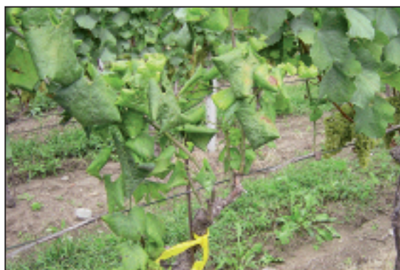
◀ Cep de Chardonnay atteint de flavescence dorée. Rebstock der Sorte Chardonnay mit Goldgelber Vergilbung.