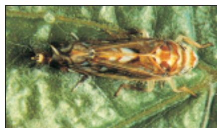
▲ Adulte de Scaphoideus titanus Ball., env. 5 mm, cicadelle vectrice de la flavescence dorée de la vigne. Scaphoideus titanus Ball., Imago, ca. 5 mm. Vektor der goldgelben Vergilbung der Rebe.