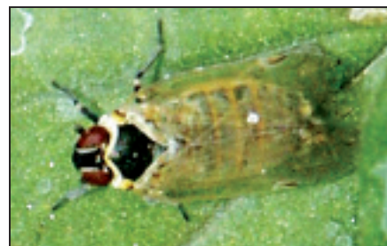
▲ Adulte de Hyalesthes obsoletus Signoret, env. 4 mm, vecteur du bois noir de la vigne. Hyalesthes obsoletus Signoret, Imago, ca. 4 mm. Vektor der Schwarzholzkrankheit der Rebe.