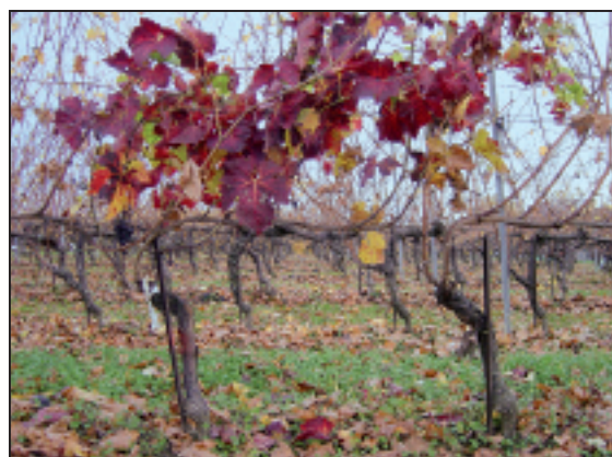
▲ Bois noir: persistance des feuilles de Gamaret en automne. Schwarzholzkrankheit: Verspätetes Abstossen der Blätter auf Gamaret.