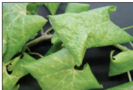
▲ Bois noir: jaunisse et enroulement de feuilles de Chardonnay. Schwarzholzkrankheit: Vergilbung und Blattrollen auf Chardonnay.