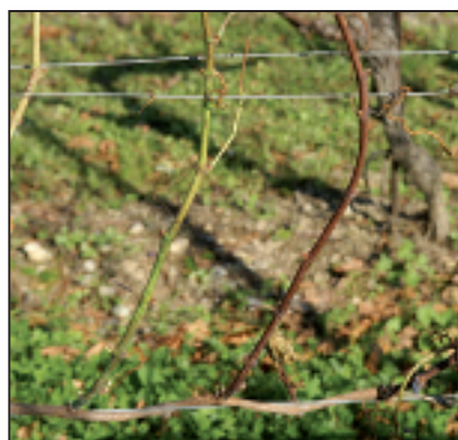
▲ Bois noir: rameaux de Gamaret non aoûtés et partiellement noircis (à gauche). Schwarzholzkrankheit: Teilweise schwarzverfärbte und unreife Ruten (links) auf Gamaret.