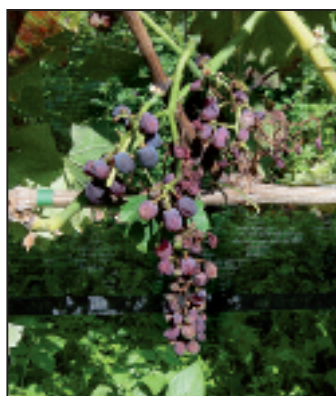
▲ Flavescence dorée: grappe de Gamaret flétrie. Goldgelbe Vergilbung: Geschrumpfte Gamaret Traube.