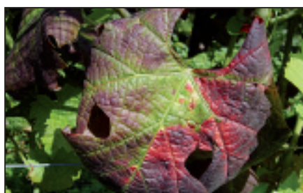
▲ Flavescence dorée: rougissement sectoriel et enroulement d'une feuille de Gamaret. Goldgelbe Vergilbung: Sektorielle Rotverfärbung und Blattrollen auf Gamaret.