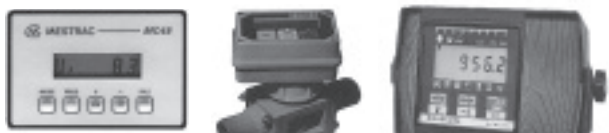
Vitesses surface Heures

Key words: biological control, strawberry, two-spotted spider mite, Tetranychus urticae , Phytoseiulus persimilis .