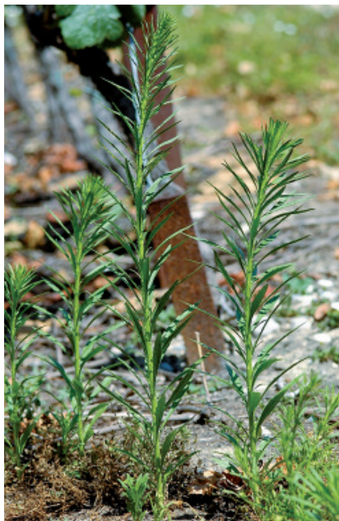
Fig. 1. La vergerette du Canada ( Conyza canadensis ) est la première espèce de dicotylédones à avoir développé des résistances au glyphosate au niveau mondial. Aujourd'hui, sur les 44 cas de résistance répertoriés par l'« International survey of herbicide resistance weeds » (Heap, 2007), 22 sont des espèces du genre Conyza , en majorité C. canadensis . Très fréquente dans notre pays, notamment dans les vignobles (Clavien et Delabays, 2006), cette espèce doit donc, avec les ray-grass ( Lolium sp. ), être particulièrement surveillée pour dépister l'apparition éventuelle d'une résistance au glyphosate.