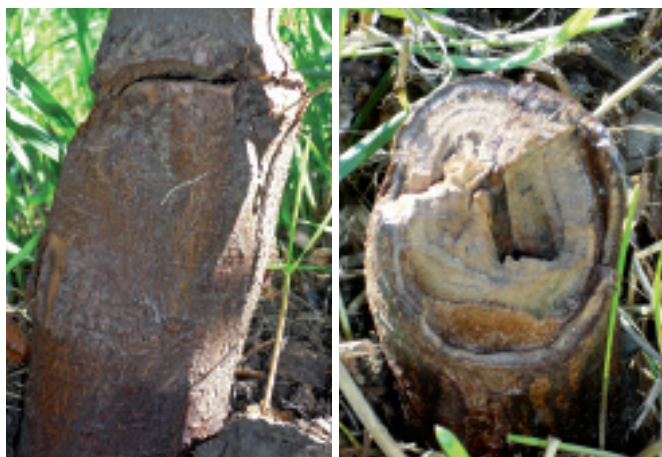
Fig. 4 et 5. Décollement et casse au point de greffe avec le G.202, attribués à l'attachage insuffisant du jeune arbre et mettant en évidence l'importance de la solidité de l'armature ainsi que l'attention à porter au palissage.

L'aptitude à la multiplication constitue un dernier point faible dans le comportement de cette série: seuls le G.16 et dans une moindre mesure le G.11 et le G.935 présentent une productivité et un enracinement qualifiés de très bons. Pour le G.202 et le G.210, ce caractère est jugé moyen et pour les autres, très médiocre; ce défaut limite sérieusement leurs chances de succès. Les premières observations sur le terrain permettront de décider de ce qui est économiquement supportable. Toutefois, compte tenu des enjeux pour l'ensemble de la profession, un rendement moyen en marcottes commercialisables devrait être toléré et il serait dommage qu'une sélection comme le G.202 qui présente une large palette de résistances soit rejetée pour ce seul motif. Le B.9 est à l'heure actuelle le seul porte-greffe présentant à la fois l'avantage d'être bien connu en Europe et très tolérant au feu bactérien (tabl.1). Malgré ses performances moyennes en marcotière, le regain d'intérêt dont il fait l'objet montre que certaines concessions sont envisageables sur ce point.