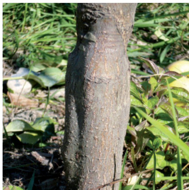
Fig. 3. Point de greffe du G.202 avec la variété Goldrush illustrant l'absence de drageons, de bourrelet de greffe et de broussins.

Des essais américains et français indiquent une productivité et un calibre des fruits comparables à ceux du témoin, respectivement M9 pour les types faibles et M26 ou M7 pour les plus vigoureux. Seul le G.210 se distingue par son exceptionnelle résistance à de nombreux pathogènes plutôt que par ses qualités agronomiques. Le G.935 a été sélectionné plus tardivement que son concurrent G.202, mais semble le surpasser assez nettement pour la productivité et le calibre des fruits. Son niveau de tolérance aux maladies du sol est en revanche moins bien connu.