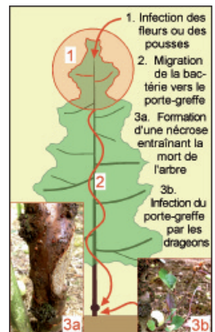
Fig. 2. Représentation schématique du processus d'infection par le feu bactérien aboutissant à la mort de l'arbre.