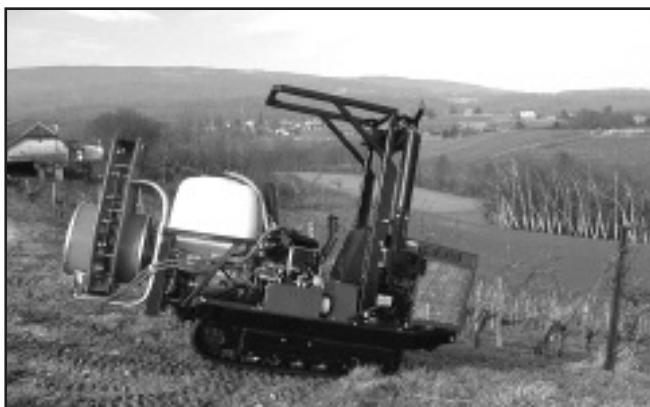
Tracteur Viti-plus équipé d'un sulfatage