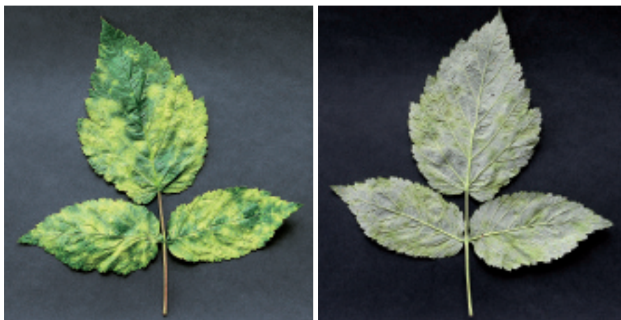
Fig 2. Face supérieure et inférieure d'une feuille de framboisier attaquée par l'ériophyde des framboises.

Les piqûres de P. gracilis engendrent l'apparition, sur la face supérieure et inférieure du limbe, de taches chlorotiques vert-jaunes quelquefois diffuses et peuvent occasionner un gaufrage plus ou moins marqué des feuilles (fig.1 et 2). Ces dégâts ne doivent pas être confondus avec des symptômes de maladies virales ou des phytotoxicités liées à l'application de produits phytosanitaires. Gordon et al. (1997) signalent que les plantations poussant à l'ombre de haies ou de forêts sont plus fortement attaquées par P. gracilis .