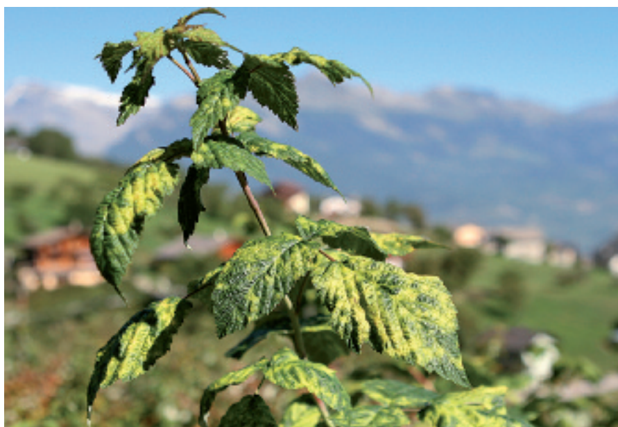
Fig. 1. Dégâts de l'ériophyide du framboisier: taches chlorotiques jaunâtres et déformations sur feuilles (Nendaz, Valais).

L'acarien ériophyide Phyllocoptes gracilis (Nalepa) est un important ravageur secondaire dans les cultures de framboises en Suisse. Comme le bromopropylate – seul acaricide autorisé contre ce ravageur – sera bientôt retiré du marché, de nouvelles stratégies de lutte sont nécessaires. En automne 2006, un premier essai d'efficacité a été mené à Nendaz (Valais) dans une culture de la variété Glen Ample fortement attaquée. L'application post-récolte d'un traitement unique de soufre mouillable ou de spirodiclofène a donné d'excellents résultats. Les contrôles visuels effectués le printemps suivant ont confirmé l'intérêt de cette stratégie. Le coût d'une intervention post-récolte à l'aide de soufre mouillable est inférieur à celui d'une application de bromopropylate et la période de traitement n'entraîne pas de risques de résidus. L'efficacité à long terme, la phytotoxicité ainsi que la période optimale d'intervention des produits testés restent cependant à déterminer avant d'envisager leur homologation contre P. gracilis .