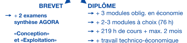
Fig. 2. Schéma de la formation arboricole offerte à l'EIC.

et les étudiants ont ainsi accès à des installations novatrices et peuvent bénéficier de la grande expertise des professionnels de Conthey dans le domaine de la conservation des fruits, de la conduite de l'arbre fruitier et de la connaissance des variétés fruitières. Ils peuvent ainsi compter sur les meilleurs experts helvétiques en la matière.