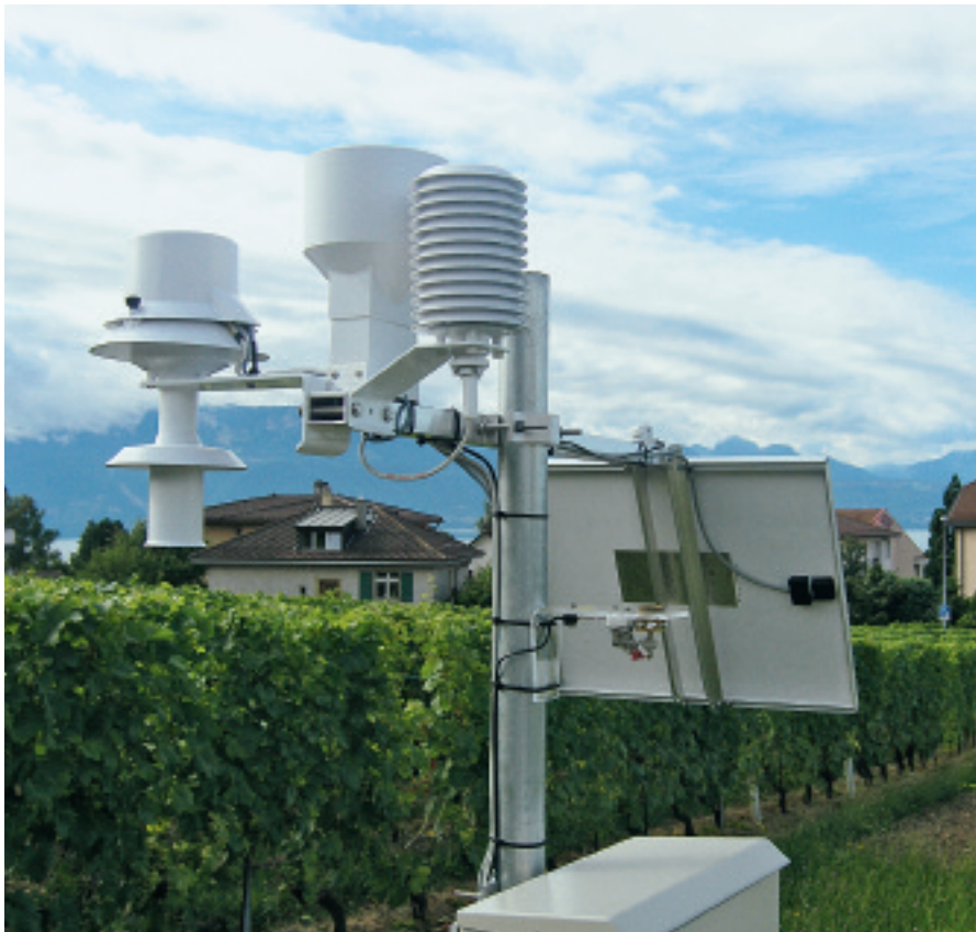
Station de mesure du domaine viticole d'ACW à Pully. Capteurs de température, humidité, pluviométrie, rayonnement solaire et humectage.

La plateforme Internet www.agrometeo.ch , développée dès l'an 2000 par la Station de recherche Agroscope Changins-Wädenswil ACW, propose désormais des données prévisionnelles à cinq jours pour la température et les précipitations. Ces valeurs, modélisées au niveau microclimatique pour chaque station de mesure, sont intégrées dans les prévisions d'attaque du mildiou de la vigne et des vers de la grappe.