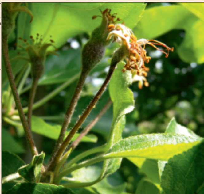
Premiers symptômes sur inflorescence (11.5.2011).