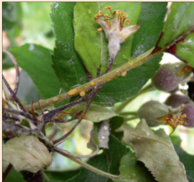
Formation d'exsudat sur Gala: la bactérie peut se propager par la pluie (12.5.2011).

L'infection apparaît souvent au niveau des fleurs: les bouquets floraux meurent, les feuilles brunissent depuis le pétiole, montrent un triangle brun typique et restent attachées aux rameaux. Les jeunes fruits prennent une couleur brun-noir et un aspect légèrement ridé. La maladie peut se développer rapidement sur les jeunes pousses et les branches. Des colorations rouge-brun à brun foncé sont visibles sous l'écorce. En automne, la maladie peut aussi se déclarer sur les porte-greffe. Les extrémités de rameaux attaquées prennent une forme de crosse typique. Des gouttelettes jaunâtres d'exsudat bactérien peuvent être observées sur les organes malades.