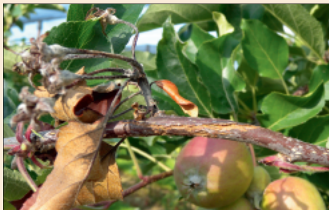
Formation de chancres après infection florale (21.6.2011).