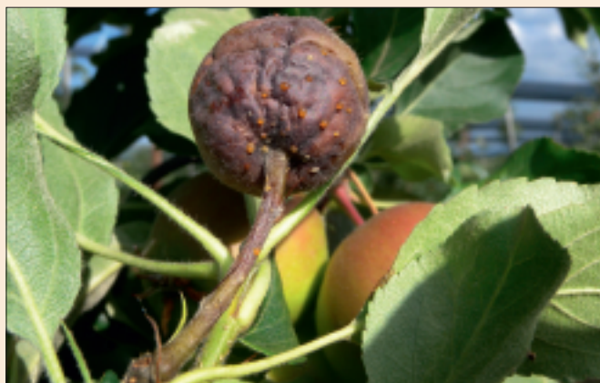
Symptômes sur pommes: les mesures d'hygiène doivent être respectées lors de l'éclaircissage manuel (21.6.2011).

Le Regalis est homologué contre les infections secondaires comme régulateur de croissance. Deux applications sont recommandées (traitement fractionné). Stades d'application: premier traitement quand les tiges ont trois à cinq feuilles complètement développées. Un second traitement est préconisé après trois à cinq semaines. Ne pas mélanger avec des engrais foliaires à base de calcium (appliquer deux jours avant le traitement au Ca). Un délai d'au moins deux jours est recommandé entre l'application de Regalis et un traitement avec les produits utilisés pour l'éclaircissage de la récolte et la diminution de rugosité des fruits.