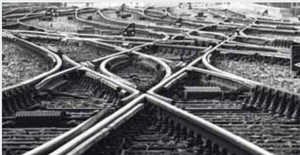
Quelle voie choisir avec l'entreprise vitivinicole – à long terme?.

Des améliorations et des ajustements dans la direction d'une entreprise vitivinicole n'engendrent généralement que des changements infimes. L'efficacité ou l'efficiency d'un domaine sont souvent englouties dans la gestion des affaires courantes ou tout simplement négligées.