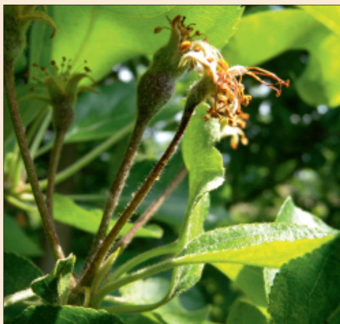
Premiers symptômes sur inflorescence.

L'infection apparaît souvent au niveau des fleurs: les bouquets floraux meurent, les feuilles brunissent depuis le pétiole, montrent un triangle brun typique et restent attachées aux rameaux. Les jeunes fruits prennent une couleur brun-noir et un aspect légèrement ridé. La maladie peut se développer rapidement sur les jeunes pousses et les branches. Des colorations rouge-brun à brun foncé sont visibles sous l'écorce. En automne, la maladie peut aussi se déclarer sur les porte-greffe. Les extrémités de rameaux attaquées prennent une forme de crosse typique. Des gouttelettes jaunâtres d'exsudat bactérien peuvent être observées sur les organes malades.