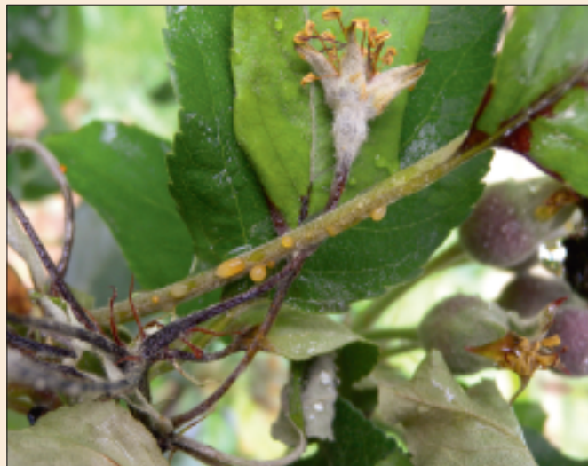
Formation d'exsudat sur Gala: la bactérie peut se propager par la pluie.