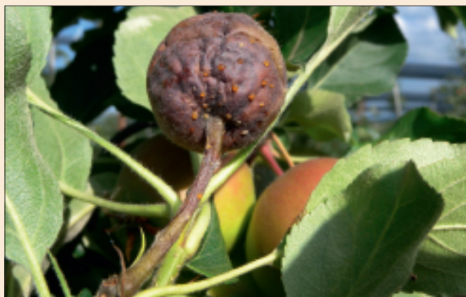
Symptômes sur pommes: les mesures d'hygiène doivent être respectées lors de l'éclaircissage manuel.

Le Regalis est homologué contre les infections secondaires comme régulateur de croissance. Deux applications sont recommandées (traitement fractionné). Stades d'application: premier traitement quand les tiges ont trois à cinq feuilles complètement développées. Un second traitement est préconisé après trois à cinq semaines. Ne pas mélanger avec des engrais foliaires à base de calcium (appliquer deux jours avant le traitement au Ca). Un délai d'au moins deux jours est recommandé entre l'application de Regalis et un traitement avec les produits utilisés pour l'éclaircissage de la récolte et la diminution de rugosité des fruits.