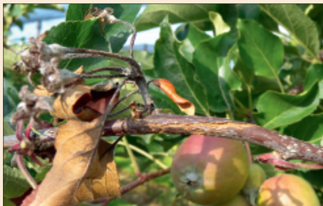
Formation de chancres après infection florale.