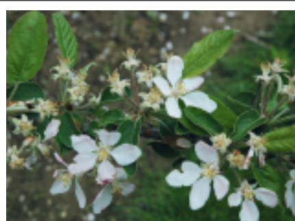
Chute des pétales

► Bicarbonate de potassium: le bicarbonate de potassium (Armicarb®) est homologué comme fongicide contre différentes maladies en arboriculture, viticulture et cultures maraîchères. Depuis le printemps 2011, le bicarbonate de potassium est également homologué pour l'éclaircissage chimique des pommiers, ce qui est très intéressant, en particulier pour la production biologique. L'effet éclaircissant est obtenu avec cette matière active en desséchant et en brûlant les fleurs. En général, deux traitements à 10-15 kg/ha sont appliqués sur la fleur. Aucun traitement ne devrait être effectué si l'humidité de l'air est élevée ou après une pluie.