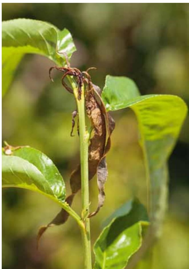
Figure 3 | Dégât de la tordeuse orientale sur une pousse de pêche.

En 2012, les producteurs du bassin lémanique ont signalé pour la première fois des attaques marquées sur les pêches et les poires. Dans certaines exploitations de La Côte, plus de 10% de fruits ont été touchés et les identifications d'Agroscope ont confirmé qu'il s'agissait bien de larves de