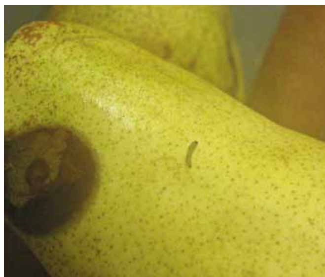
Figure 4 | Dégât et larve de la tordeuse orientale du pêcher sur une poire.