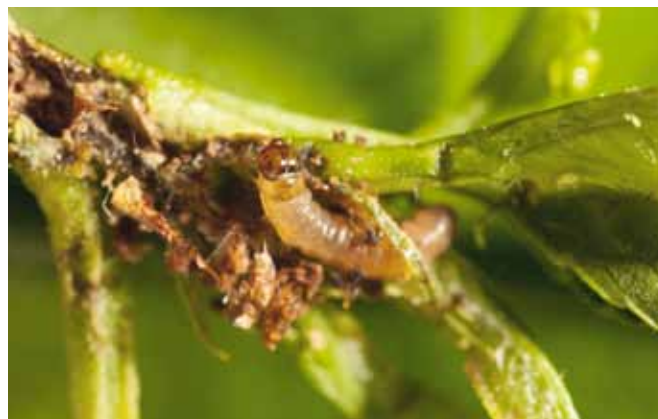
Figure 2 | Larve de la tordeuse orientale du pêcher.