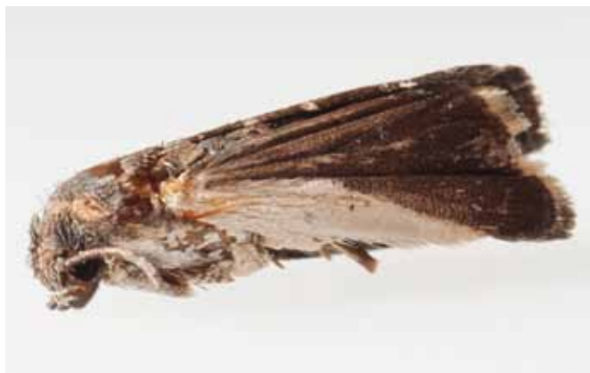
Figure 1 | Adulte de la tordeuse orientale du pêcher.