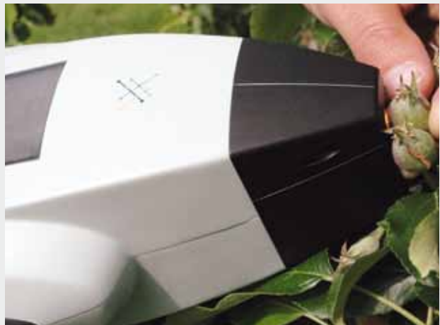
Figure 3 | Utilisation de l'appareil NIR. Pour cette étude, les fruits ont été mesurés avec le spectromètre proche infrarouge Phazir (PZ1018, Polychromix). Cet appareil permet d'obtenir un spectre d'absorption de 930 à 1800 nm.

Après avoir calibré le procédé avec plus de 1000 fruits, des différences ont été perçues entre les fruits qui devaient chuter et ceux qui devaient poursuivre leur maturation. Pourtant, avec un taux de seulement 58 %, des prévisions de la charge n'étaient pas possibles. L'interprétation des résultats est rendue plus difficile par les facteurs externes – comme l'année de récolte, les conditions météorologiques, la situation ou la position du fruit sur l'arbre –, qui exercent une plus grande influence sur le spectre NIR que les modifications physiologiques conduisant à la chute. La différence entre les fruits destinés à chuter et ceux poursuivant leur maturation était plus marquée lorsque la chute effective du fruit était très proche. Les prévisions étaient