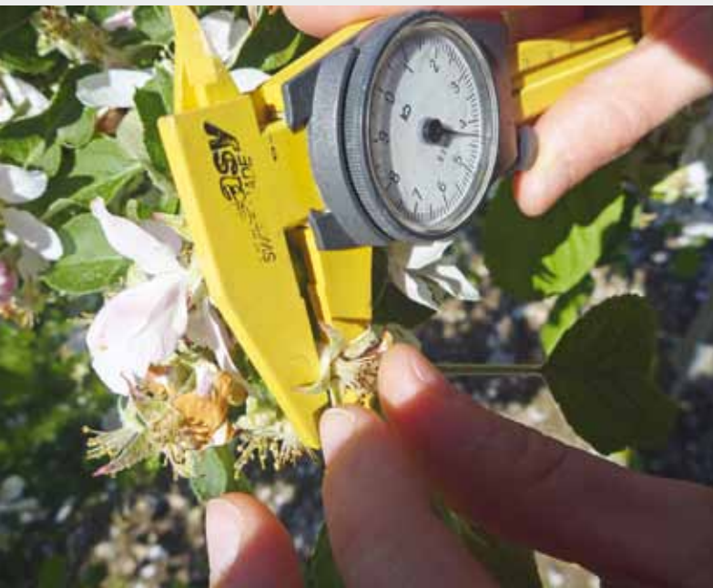
Figure 1 | Première mesure du diamètre du fruit de la variété Nicoter, le 14 mai 2013.

Renseignements: Simon Schweizer, e-mail: simon.schweizer@agroscope.admin.ch, tél. +41 58 460 61 91, www.agroscope.ch