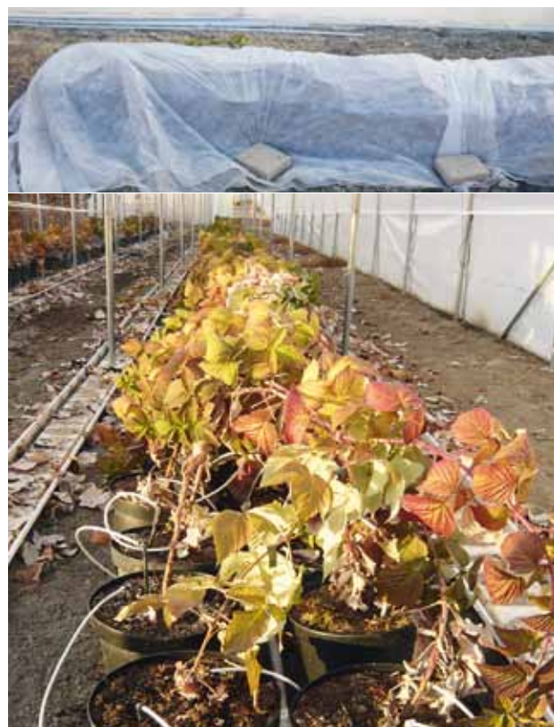
Figure 1 | Hivernage: les tiges sont couchées sur les pots et recouvertes d'une toile tissée (en haut).

Dans cet essai, l'hivernage au frigo a été comparé à l'hivernage à l'extérieur et sous tunnel. Le tableau 2 présente les différentes modalités de l'essai d'hivernage.