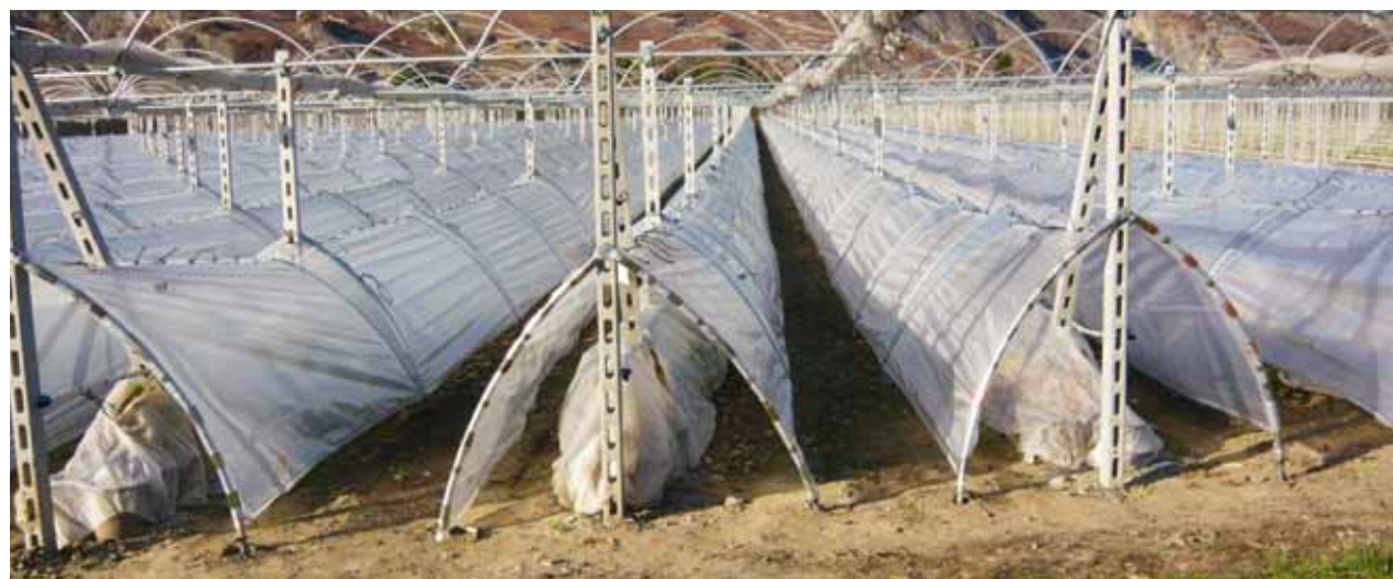
Figure 2 | Système remplaçant le tunnel pour les régions avec de la neige.

Les valeurs suivies de la même lettre ne se distinguent pas significativement à P < 0,05 .