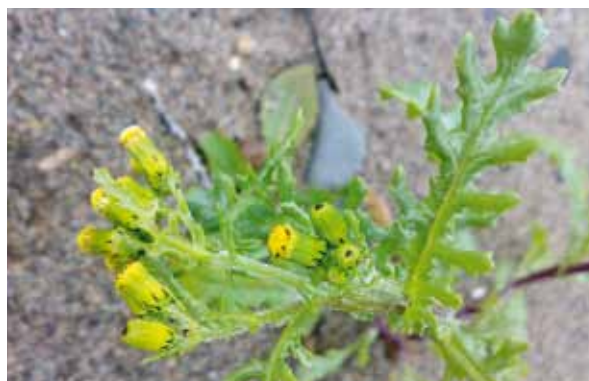
Le séneçon vulgaire ( Senecio vulgaris ).