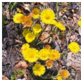
Le tussilage ( Tussilago farfara ).