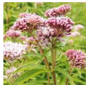
L'eupatoire ( Eupatorium cannabinum ).