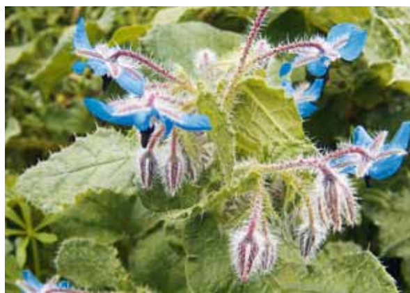
La bourrache ( Borago officinalis ).