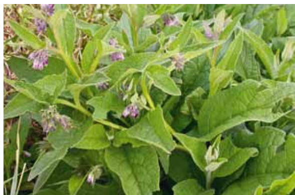
La consoude ( Symphytum officinalis ).