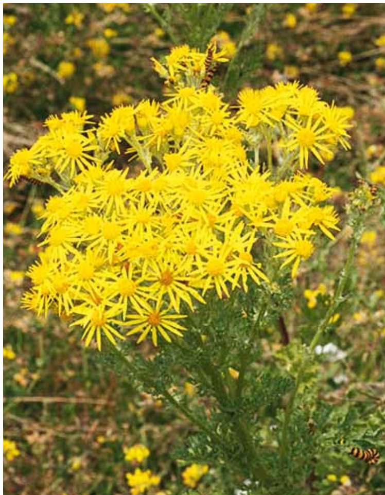
Le séneçon jacobée, adventice riche en alcaloïdes.