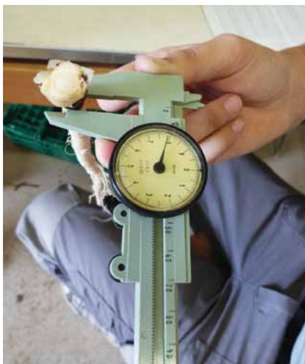
Mesure du diamètre du collet de Pimpinella peregrina .

0,02 %, ce qui explique la faible différence entre les variantes. En effet, dans les faibles densités de semis, la teneur en huile essentielle est pénalisée par les grosses racines, qui ont une proportion plus élevée de tissus centraux vascularisés (14,1 à 17,7 % de la biomasse des racines), tandis que les hautes densités de semis produisent davantage de racines fines pauvres en huile essentielle (tabl. 9 et 10).