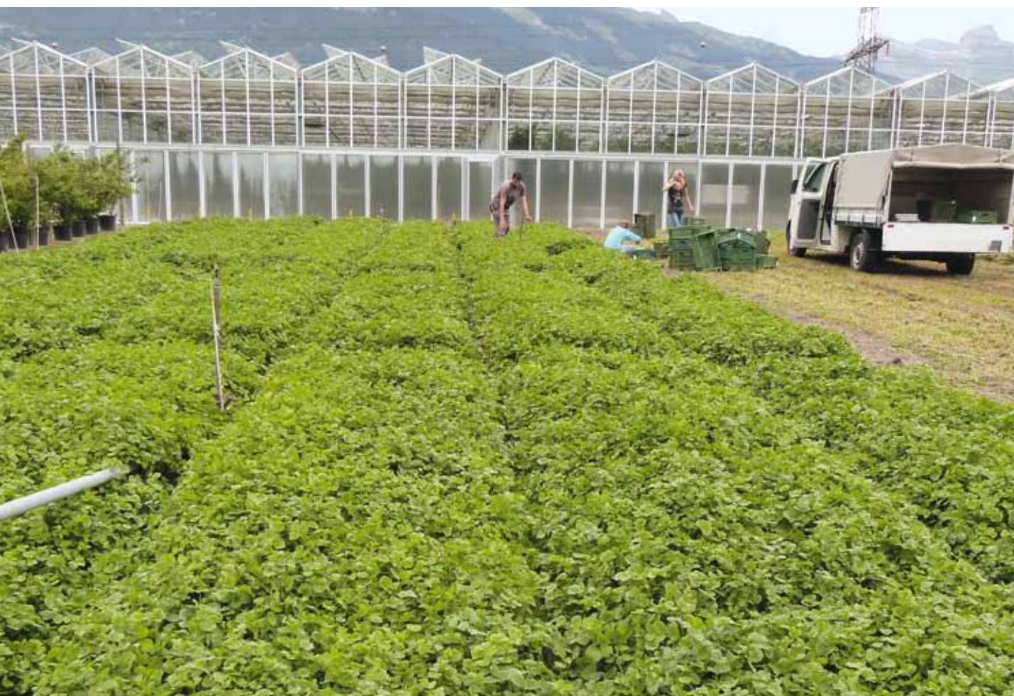
Figure 1 | Vue générale de l'essai de densité de semis de Pimpinella peregrina à Conthey (VS); première date de récolte.

Renseignements: claude-alain.carron@agroscope.admin.ch, tél. +41 27 345 35 11, www.agroscope.ch