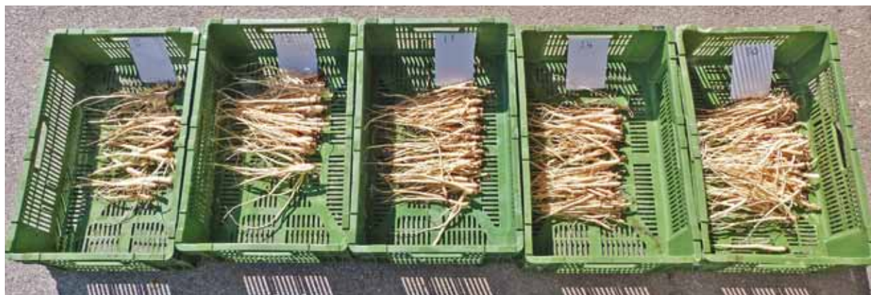
Figure 3 | Racines de Pimpinella peregrina lavées avant le séchage. Effets de la densité de semis sur le nombre de racines récoltées lors de la semaine 39.

Les analyses statistiques ont été faites avec XLSTAT 2014 (one way ANOVA et Tukey-test).