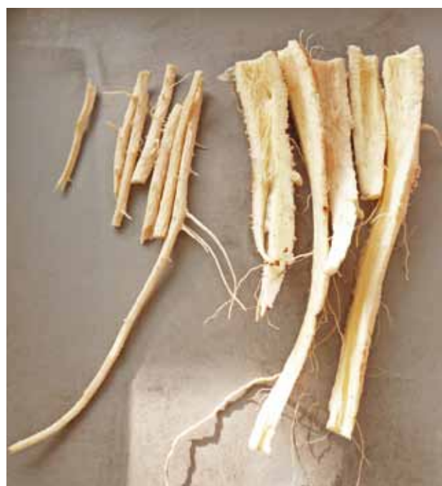
Figure 5 | Racines de Pimpinella peregrina décortiquées pour analyser séparément les tissus centraux vascularisés (à gauche) et ceux du périderme et du cortex (à droite).

Les lettres différentes indiquent les différences significatives ( P > 0,05 test de Tukey).