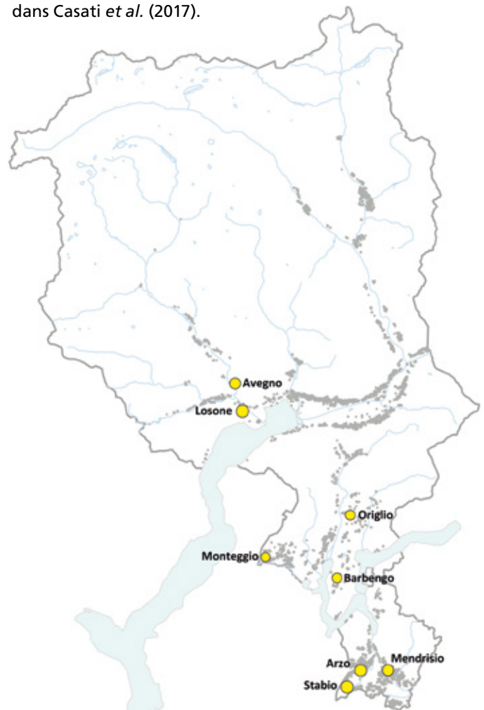
Figure 1 | Répartition géographique des parcelles échantillonnées dans le vignoble tessinois (cercles jaunes) par rapport à la distribution géographique des vignobles tessinois (cercles gris).

Le diagnostic moléculaire visant à établir la présence ou l'absence de FD dans un échantillon donné a été effectué dans le laboratoire de phytoplasmodiologie à Agroscope Changins (voir ci-après). La caractérisation génétique des souches de FD présentes dans la vigne, des cicadelles et des plantes hôtes potentielles a été faite en 2014 uniquement; elle est décrite plus en détail dans Casati et al. (2017).