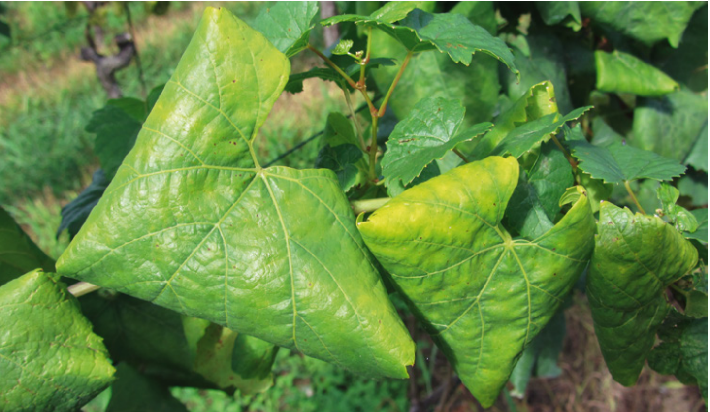
Feuille de Chardonnay avec symptômes caractéristiques de flavescence dorée: jaunissement et enroulement angulaire et serré vers le bas.

Renseignements: Mauro Jermini, e-mail: mauro.jermini@agroscope.admin.ch, tél. +41 58 466 00 32, www.agroscope.ch