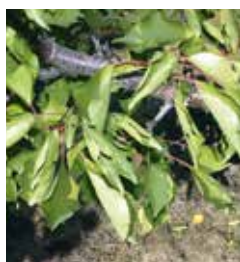
Enroulement et chlorose (jaunissement) foliaire.

La maladie touche avant tout l'abricotier, le pêcher et le prunier japonais.