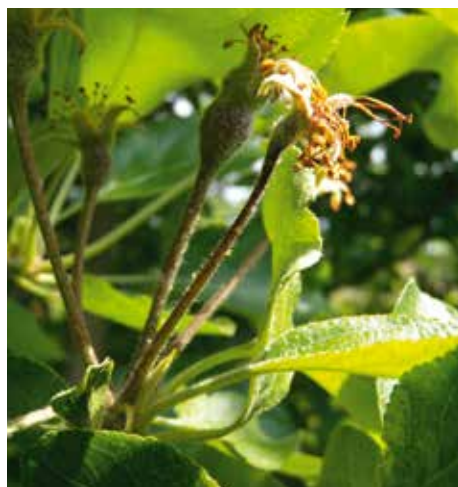
◀ Premiers symptômes sur inflorescence.

Outre pommiers, poiriers et cognassiers, les plantes sauvages et ornementales suivantes sont attaquées: l'aubépine ( Crataegus ), toutes les espèces de sorbiers, par exemple le sorbier des oiseleurs ( Sorbus aucuparia ) ou l'allier ( S. aria ), l'amélanchier ( Amelanchier ), le cotonéaster, le