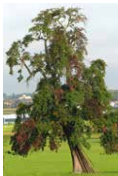
Rougissement précoce du feuillage.

La maladie touche avant tout le poirier et le cognassier.