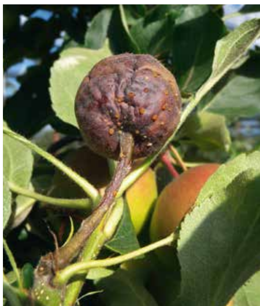
Symptômes sur pommes: les mesures d'hygiène doivent être respectées lors de l'éclaircissage manuel.

Les jours de grand risque d'infection, il convient de renoncer ou de repousser les traitements phytosanitaires demandant de grands volumes d'eau.