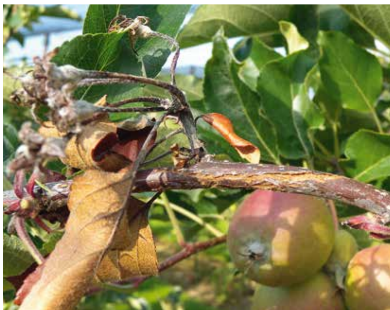
Formation de chancres après infection florale.