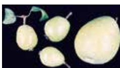
Rabougrissement des fruits.