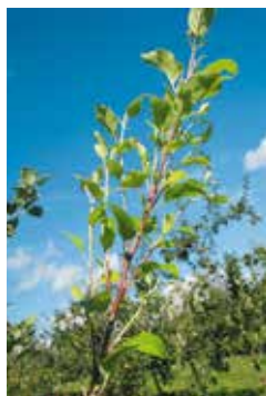
Balai de sorcière.

La maladie touche essentiellement le pommier.