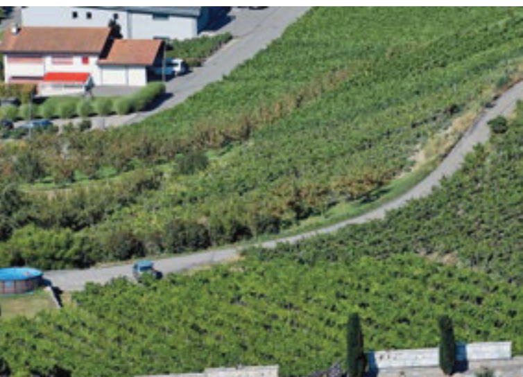
Parcelles d'abricotiers dans le village de Saxon.

de lutte contre les maladies, ravageurs et accidents climatiques.