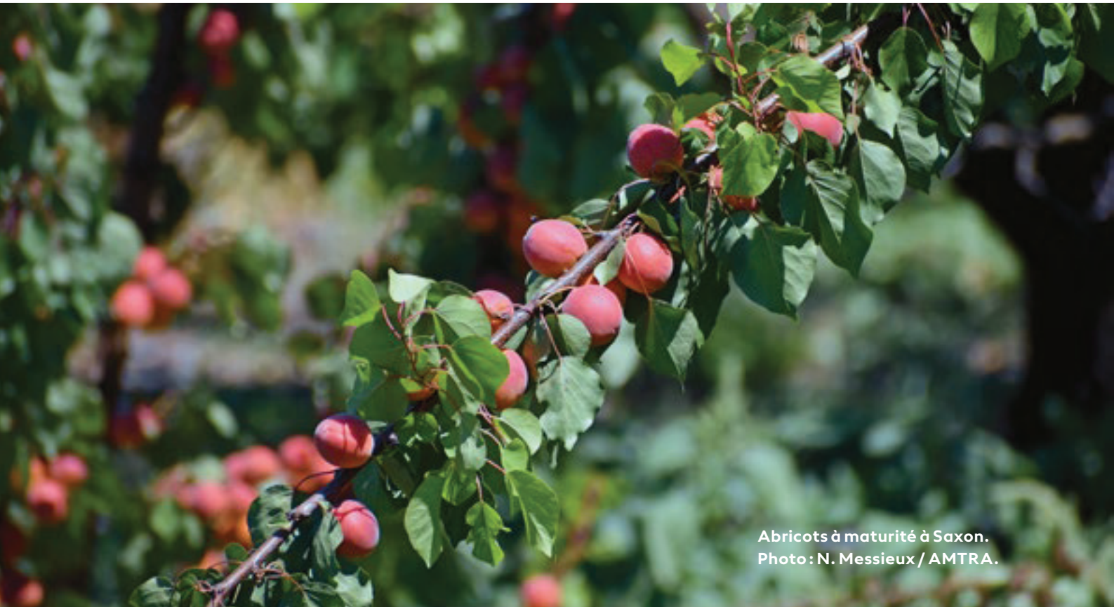
Abricots à maturité à Saxon.

Mais Saxon, au travers de la présence proche de l'Agroscope de Conthey, est aussi un haut-lieu de la recherche agronomique autour de l'abricot et de la sélection et du développement de nouvelles variétés, de techniques de stockage et de moyens