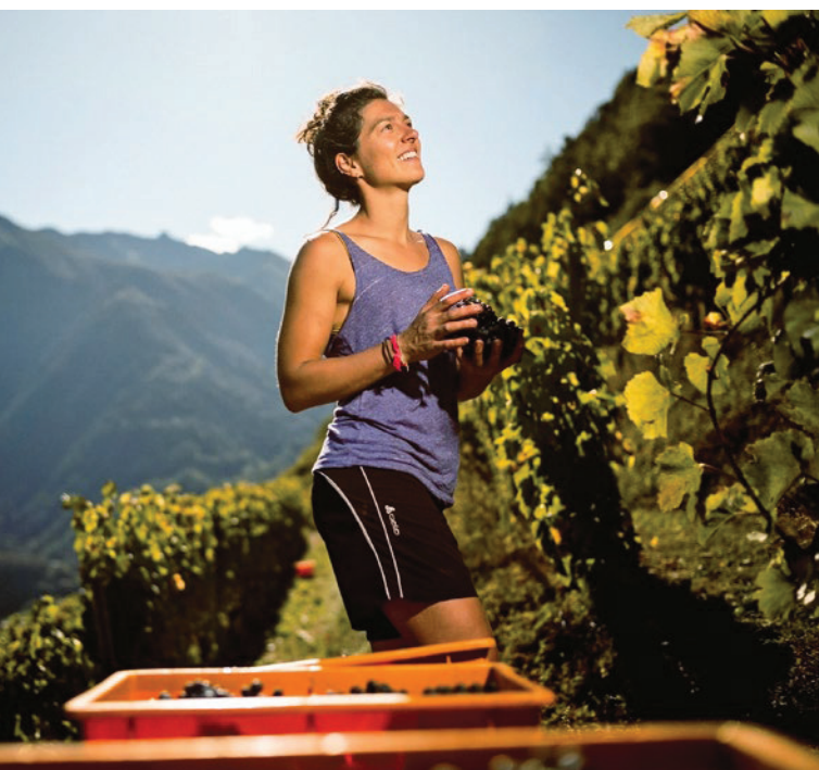
Une des photos utilisées pour la campagne © Olivier Maire.