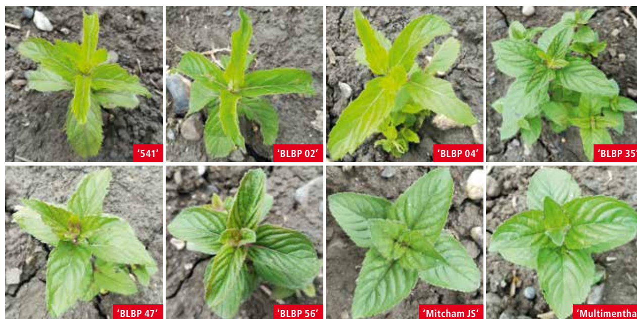
Figure 2 | Jeunes plantes des huit clones comparés. Trois de forma palescens menthe blanche: '541', 'BLBP 02' et 'BLBP 04'. Cinq de forma rubescens menthe noire: 'BLBP 35', 'BLBP 47', 'BLBP 56', 'Mitcham JS' et 'Multimentha'.

* LfL: Bayerische Landesanstalt für Landwirtschaft