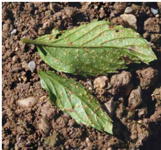
Figure 4 | Sporulation de la rouille ( Puccinia menthae ) sur la face adaxiale d'une feuille de menthe poivrée forma palescens à Zollbrück en 2016.