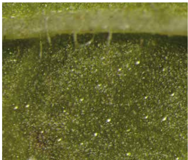
Figure 5 | Trichomes (glandes sécrétrices d'huile essentielle) sur la face adaxiale d'une feuille de Mentha x piperita .

au champ a été déterminée à l'aide d'un appareil de calcul de surface (LI-3100, LI-COR Inc., Lincoln, NE, USA). Le 8 septembre 2017, entre 12 h et 14 h, le taux de photosynthèse nette a été mesuré sur cinq feuilles