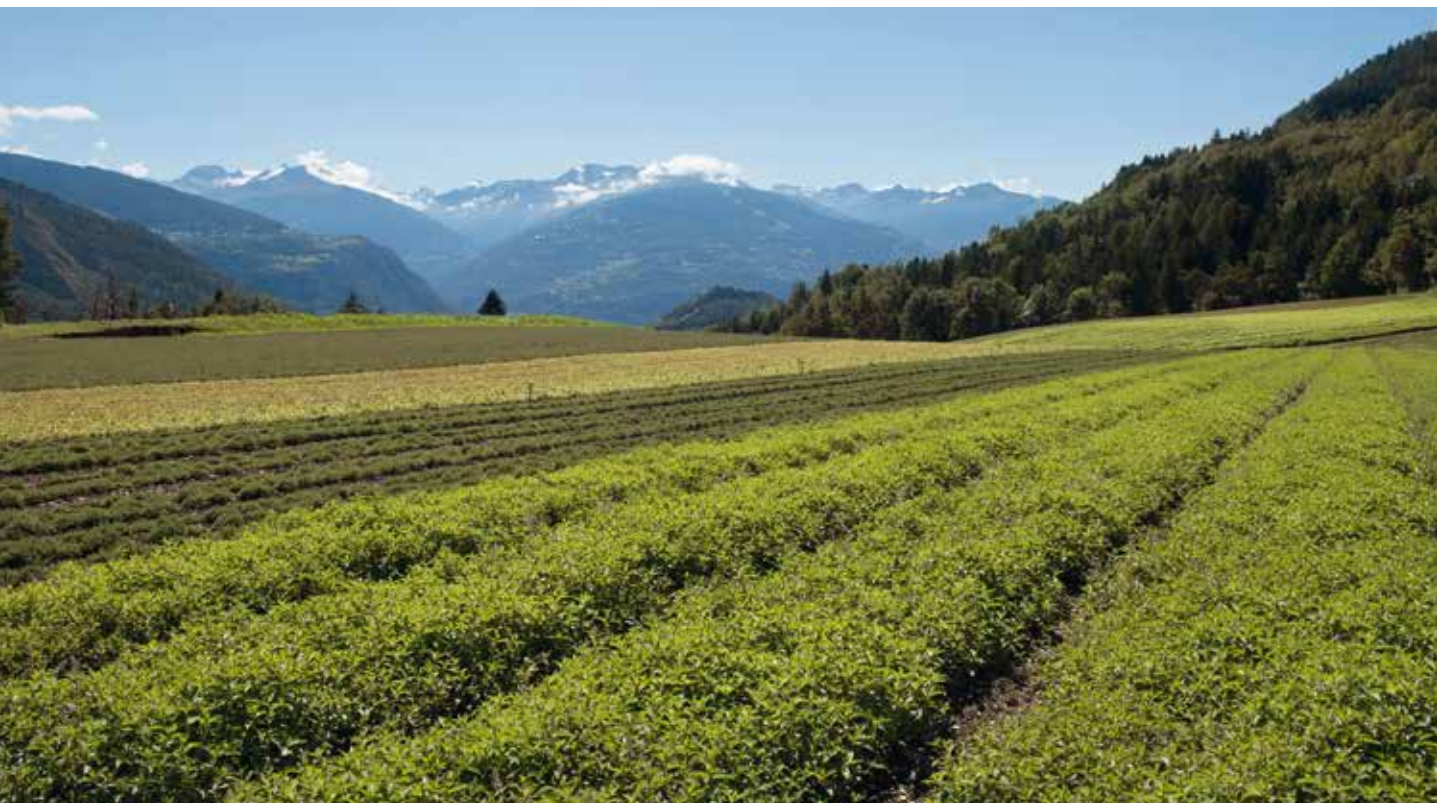
Figure 1 | Cultures de plantes aromatiques et médicinales à Ayent, sur l'adret valaisan, à 1050 m d'altitude. Au premier plan, de droite à gauche: menthe poivrée, thym citronné, ortie dioïque, thym vulgaire. A l'arrière-plan: mélisse citronnelle.

Renseignements: Claude-Alain Carron, tél. +41 58 481 35 39, claude-alain.carron@agroscope.admin.ch, www.agroscope.ch